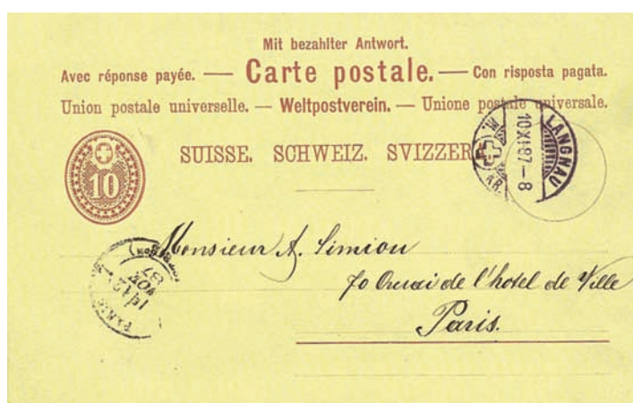
Fig. 1. Suisse: carte postale-réponse de 10 ct. portant la mention «Avec réponse payée», en trois langues, postée à Langnau en 1887 pour Paris (cachet d'arrivée au recto).

La première carte postale officielle fut celle émise par la Poste de l'Empire austro-hongrois le 1 er octobre 1869, sous le nom de Correspondenz-Karte» (trad.: «carte de correspondance»). D'autres administrations postales en firent autant quelques mois après: Wurtemberg (1 er juillet 1870), Luxembourg (1 er septembre 1870), Angleterre et Finlande (1 er octobre 1870), puis Belgique et Pays-Bas (1 er janvier 1871).