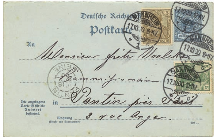
Fig. 4. Carte postale-réponse de la «Deutsche Reichspost» postée en 1900 à Mannheim pour Paris (France). A noter, en bas, en petit, la mention en allemand «La carte annexée est prévue pour la réponse».

Par contre, pour les cartes postales-réponse qui sont réexpédiées de l'étranger dans le pays qui a émis la carte, cela devient plus intéressant pour le collectionneur. La partie «Réponse» de la carte postale, donc celle qu'utilisait celui qui répondait, était pré-affranchie avec un timbre pré-imprimé du pays d'origine (administration postale émettrice de la carte postale-réponse). En réexpédiant cette carte «Réponse» par