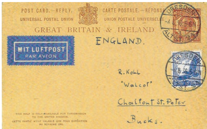
Fig. 7. Carte postale-réponse de Grande-Bretagne & Irlande (Great Britain & Ireland, POST CARD – REPLY), réexpédiée en 1936 de Dresden en Angleterre. Le cachet d’oblitération de Dresden a oblitéré le timbre anglais pré-imprimé sur la carte postale et le timbre de poste aérienne allemand (pour payer la surtaxe aérienne). A noter ici que le type de cette carte postale-réponse était «interne» (voir la mention en bas «Cette partie n’est valable que pour expédition au Royaume-Uni», trad.).

Antwortpostkarte aus Grossbritannien & Irland (Great Britain & Ireland, POST CARD REPLY), zurückgesandt in 1936 von Dresden nach England. Der Stempel von Dresden hat sowohl die vorgedruckte englische Marke (für das Flugpost-Zusatzporto). Dieser Typ war normalerweise nur für den internen Gebrauch vorgesehen (innerhalb Grossbritanniens und Irlands), laut dem klein gedruckten Hinweis unten links.