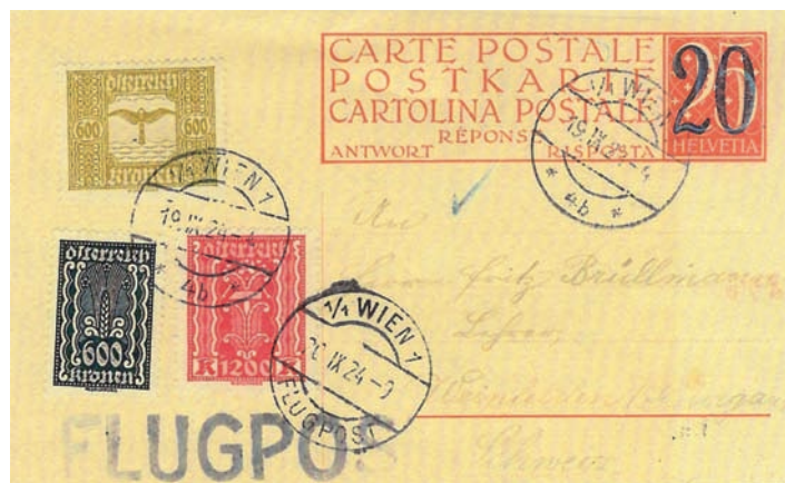
Fig. 8. Carte postale-réponse de la poste suisse (avec surcharge en noir à 20 ct.), partie «Antwort – Réponse – Risposta», réexpédiée en 1924 de Vienne à Weinfelden. Les trois timbres autrichiens ont servi à payer la surtaxe de poste aérienne.

Antwortpostkarte der Schweizer Post (mit Aufdruck zu 20 Rp.), Teil «Antwort», zurückgesandt 1924 von Wien nach Weinfelden. Die drei österreichischen Marken bezahlten das Zusatzporto für die Flugpost.