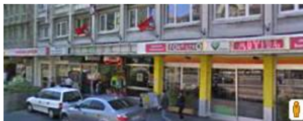
Place Chauderon 5