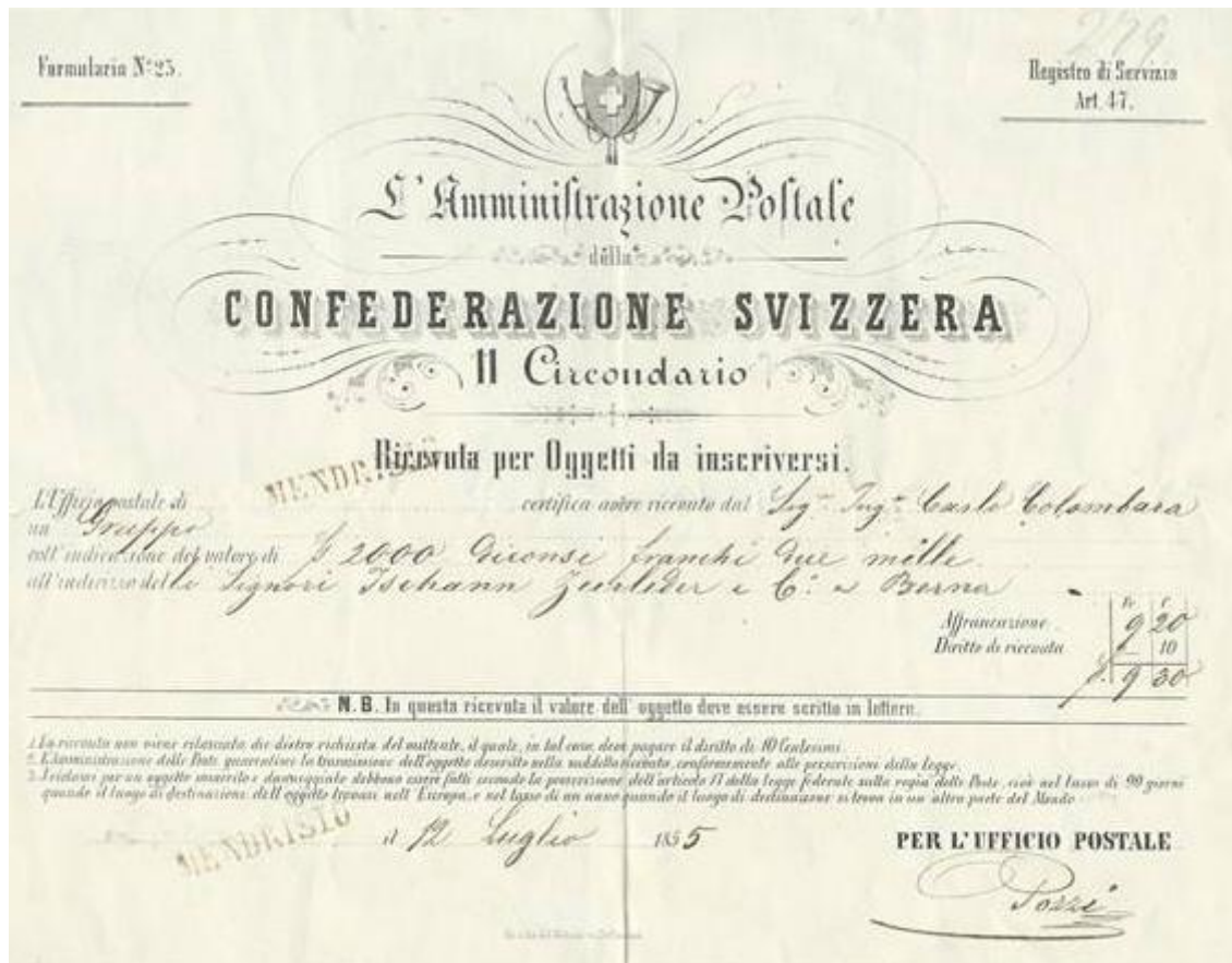
Abbildung : 23.I.4

23.I.5 Titel : „ L'AMMINISTRAZIONE POSTALE ” della “ CONFEDERAZIONE SVIZZERA ”